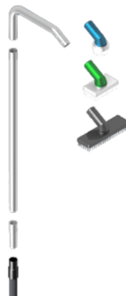
Comfortabele verleningen voor het reinigen van leidingen