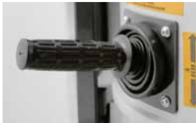
Handmatig reinigingssysteem voor filterschudders