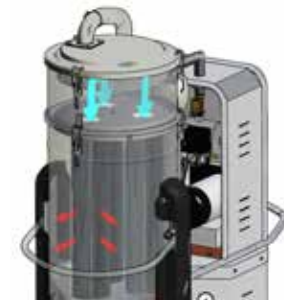
Automatische pneumatische reiniging van wissellucht tegenstroomfilters