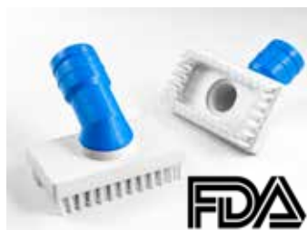
FDA gekeurde accessoires met kleurcodering ●●●●●