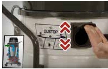
Handig reinigingssysteem voor het Dustop halfautomatische filter