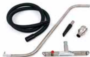
Antistatische accessoires AISI 304 roestvrij staal

Breed scala aan ergonomische accessoires voor elke specifieke aspiratiebehoefte in de farmaceutische industrie en de voedingsindustrie.